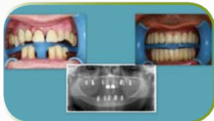
dr. med. dent. Ivica Dubravica

Implantat se već godinama najsigurnijim rješenjem nadomještanja zubi. Njegovim umetanjem, on je čvrsto povezan za kost, a time završava svaki osjećaj stranog tijela u ustima. Čeljusna kost je stimulirana kroz implantat, te se ne oblikuje nanovo. Sprječava se gubitak ostalih zubi u čeljusti, susjedni zdravi zubi nisu opterećeni, a i sačuvan je njihov prirodni izgled.