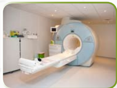
Uređaj za magnetsku rezonanciju s jedinstvenom kombinacijom glavnog magneta i vodeće tehnologije

Renomirani medicinski stručnjaci obrazovani na hrvatskim i inozemnim sveučilištima, sa iskustvom stečenim u hrvatskim i inozemnim zdravstvenim institucijama.